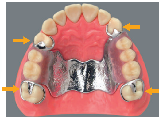
ツメの影響で摩耗することがあります