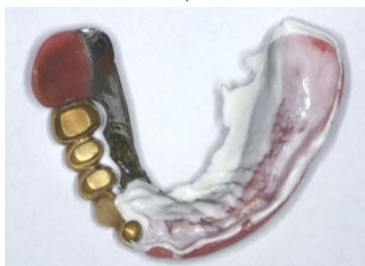
適合の修理後 すき間の白い部分が ほとんど消えました