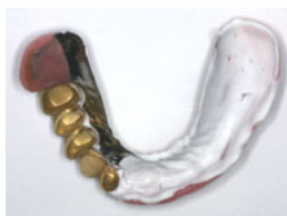
歯ぐきがやせてくると 合わなくなって すき間ができます (白い部分が すき間を調べる薬剤)