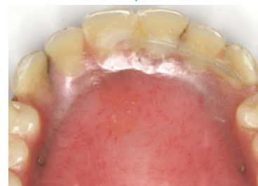
ひびが入った義歯も修理できます