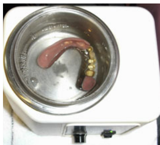
超音波や薬剤を使って 細かな部分まで清掃